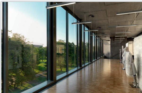
Akademia Sztuk Pięknych, Warszawa, Pilkington Insulight™ Therm