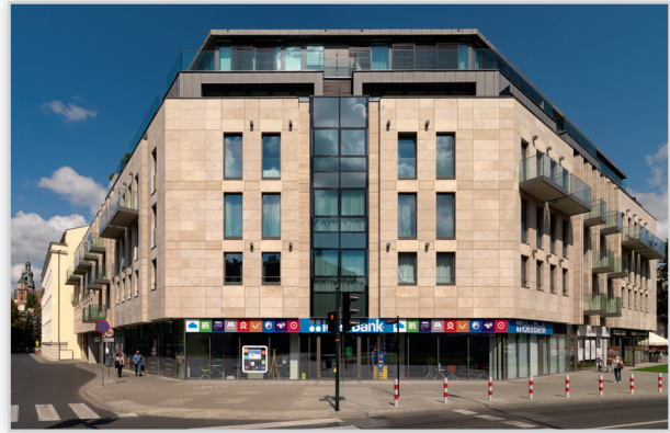
Angel Wawel, Kraków, Pilkington Insulight™ Sun