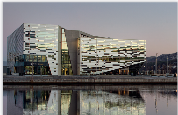
Havnespeilet, Norwegia, Pilkington Insulight™ Sun