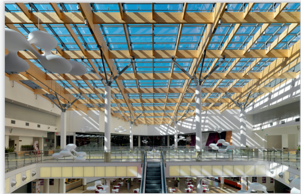
Atrium Felicity, Lublin, Pilkington Insulight™ Protect