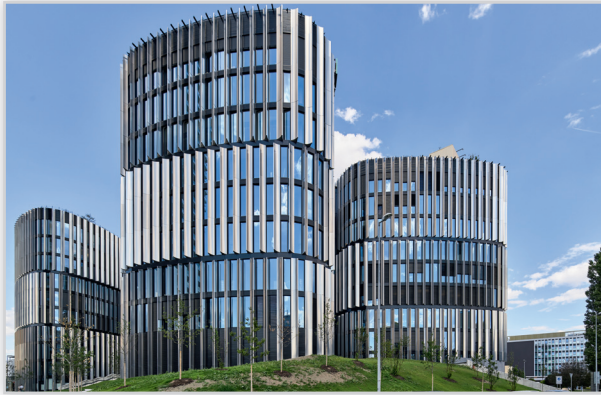
Main Point Pankrac, Czechy, Pilkington Insulight™ Activ™