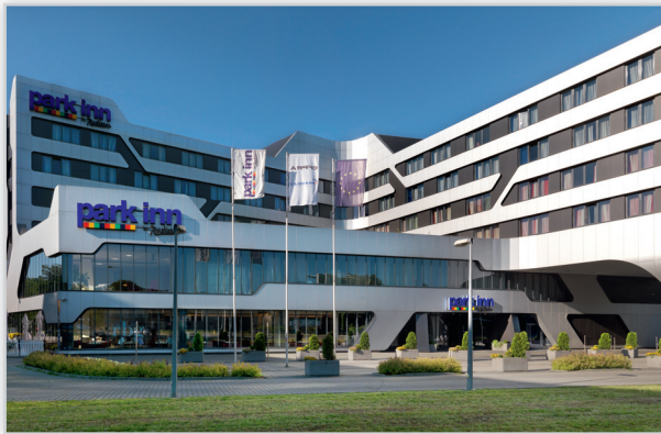
ParkInn Kraków, Pilkington Insulight™ Phon